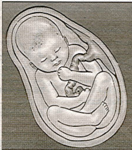
Usted puede infectar con VIH a su bebé You can give HIV to your baby

Women who are pregnant can become infected with the same sexually transmitted diseases (STDs) as women who are not pregnant. Pregnancy does not provide women or their babies any protection against STDs. The consequences of a STD in a pregnant woman and her baby can be significantly more serious, even life threatening.