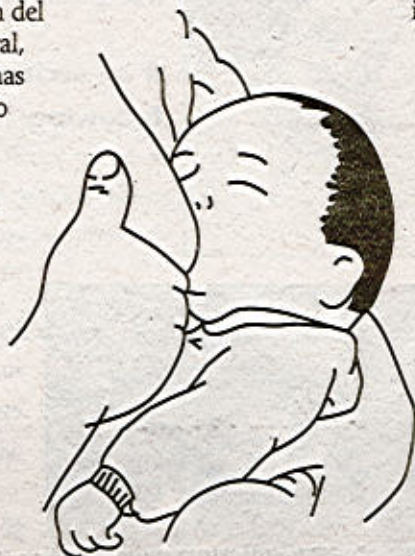
Usted puede infectar con VIH a su bebé con leche materna You can infect your child with HIV by breastfeeding

If you need more information on STDs you can call: STD Hotline 1-800-227-8922 HIV Hotline 1-800-342-AIDS